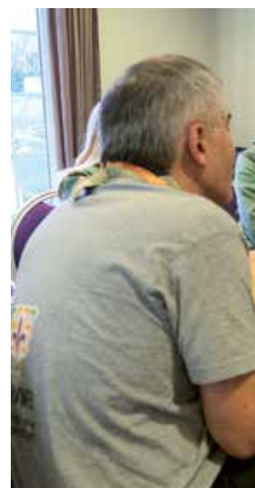
ANDERSEN Omvisning i Malhaugen for ungdomsdel av skolekomiteen i Malhaugen