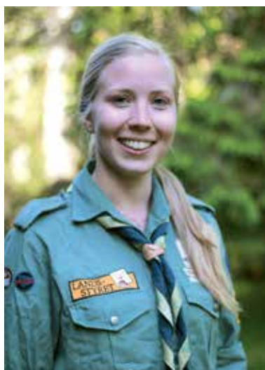
Eline har tidligere vært medlem av landsstyret og leder av Rovernemnda.

– Der var vi hver eneste helg. Vi dro alltid ut dit. Rodde i robåten, lekte i snøen og gjorde alt mulig. Det var på Bryn alt skjedde.