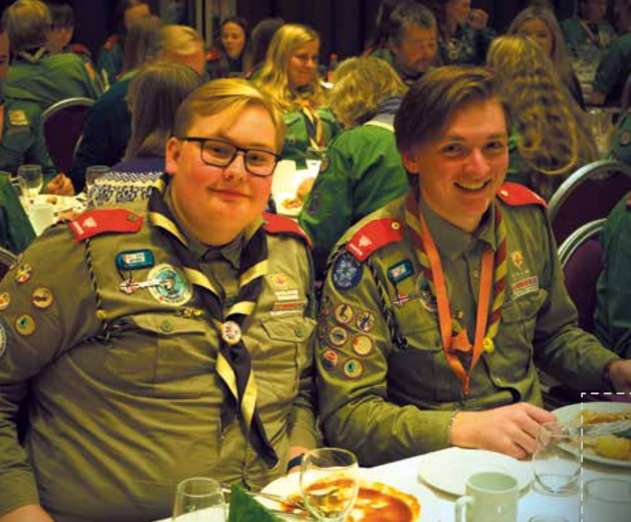
FESTMIDDAG: God stemning under middag på lørdag.