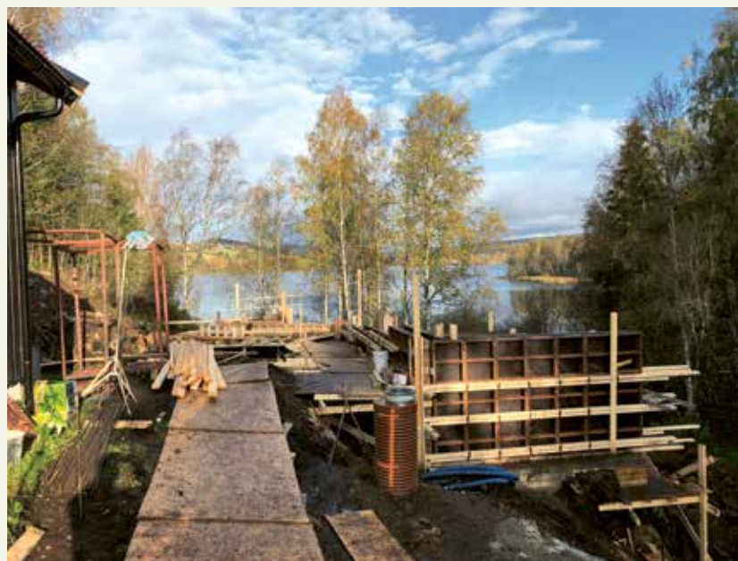
TAR FORM: Slik så det ut på byggeplassen på Nordtangen i midten av oktober.