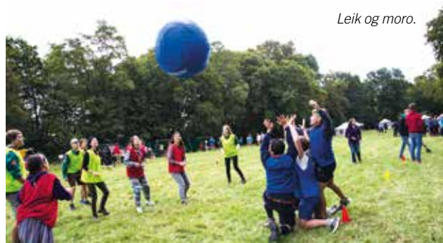
Leik og moro.