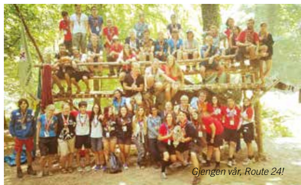
Gjengen vår, Route 24!