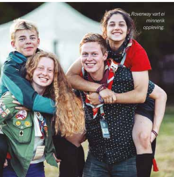
Roverway vart ei minnerik oppleving.