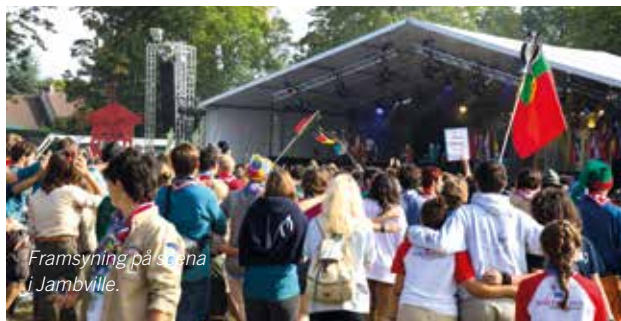
Framsýning på scena i Jambville.