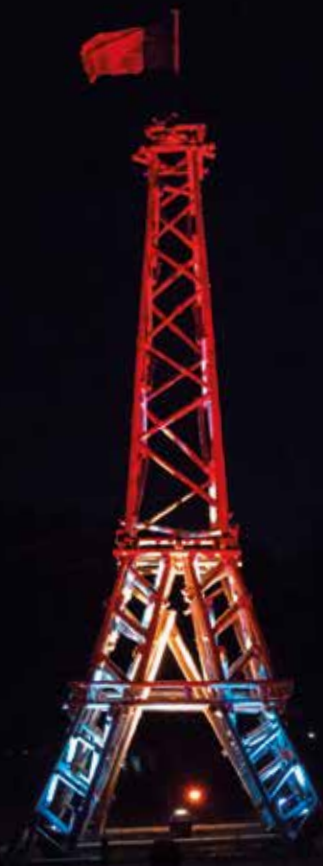
Pionert versjon av Eiffeltårnet, sjølvsgatt!

Tenk å verte sett igjen i eit lite dalføre midt på landsbygda i Frankrike, med 50 andre menneske frå land som Nederland, Belgia, England, Italia, Portugal, Frankrike, og ikkje minst Norge. Ikkje visste vi at då vi kom ut av bussen i Moulin de Lavaure, skulle eit nytt eventyr i livet starte, og at vi skulle få vener som vi kjem til å kjenne for resten av livet. Og ikkje minst ei heilt utruleg minneverdig oppleving!