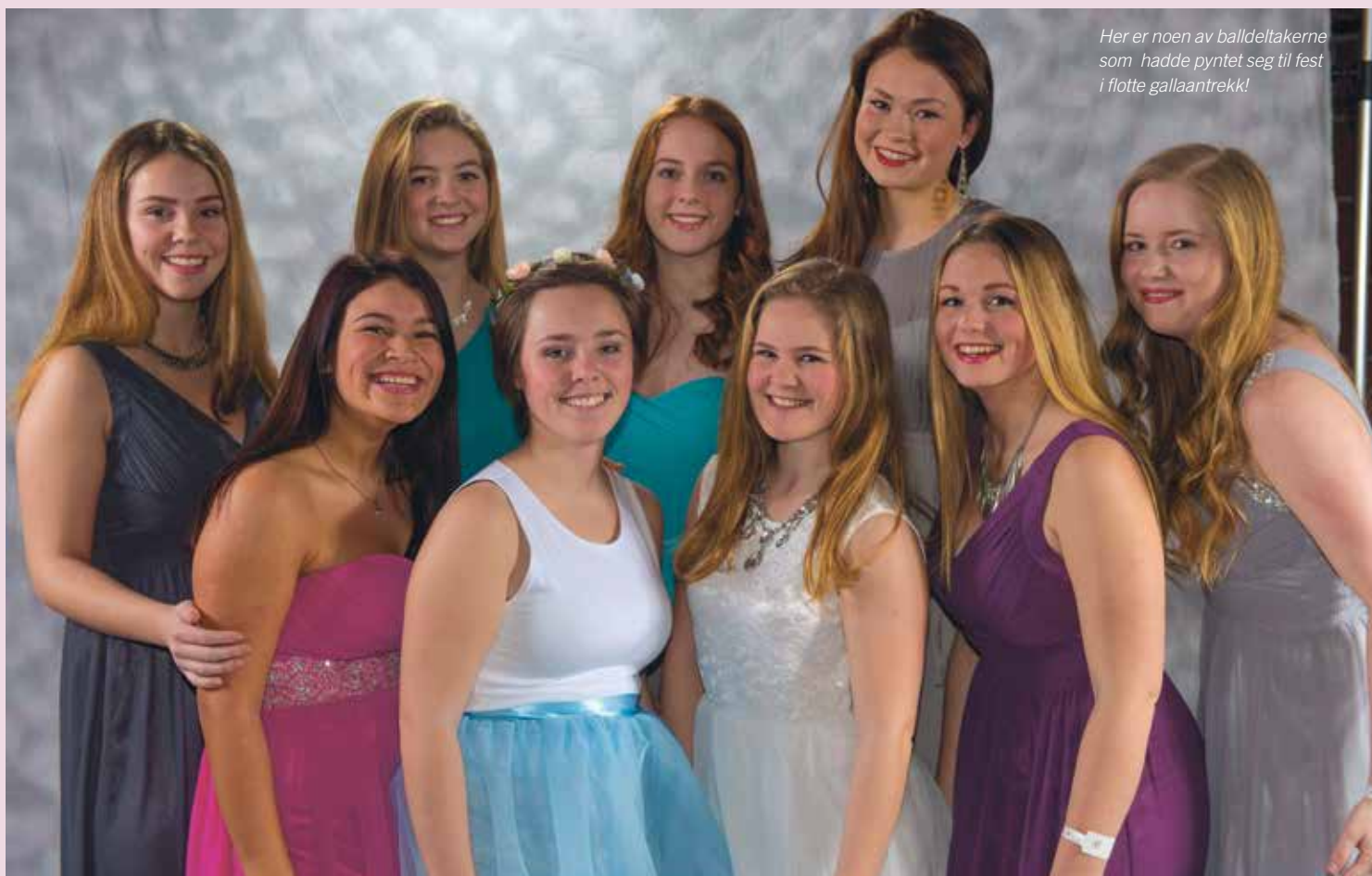
Her er noen av balldeltakerne som hadde pyntet seg til fest i flotte gallaantrekk!