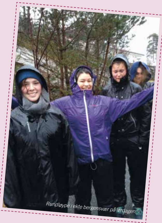
Rundløype i ekte bergensvær på lørdagen.

Da alle satt igjen med fulle mager, god selvtillit og tommel opp til kokkene, var det klart for dans! Etter at roverne hadde fått svingt fra seg på dansegulvet, ble resten av kvelden brukt til kortspill og prat. På søndag fikk roverne delta på gudstjeneste i Åsane kirke, der kollekten ble gitt til KFUK-KFUM-speiderne. Takk til Rover Bjørgvin for et godt gjennomført arrangement!